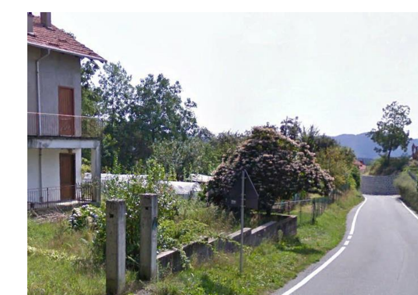
lotto B4.4 - vista da nord