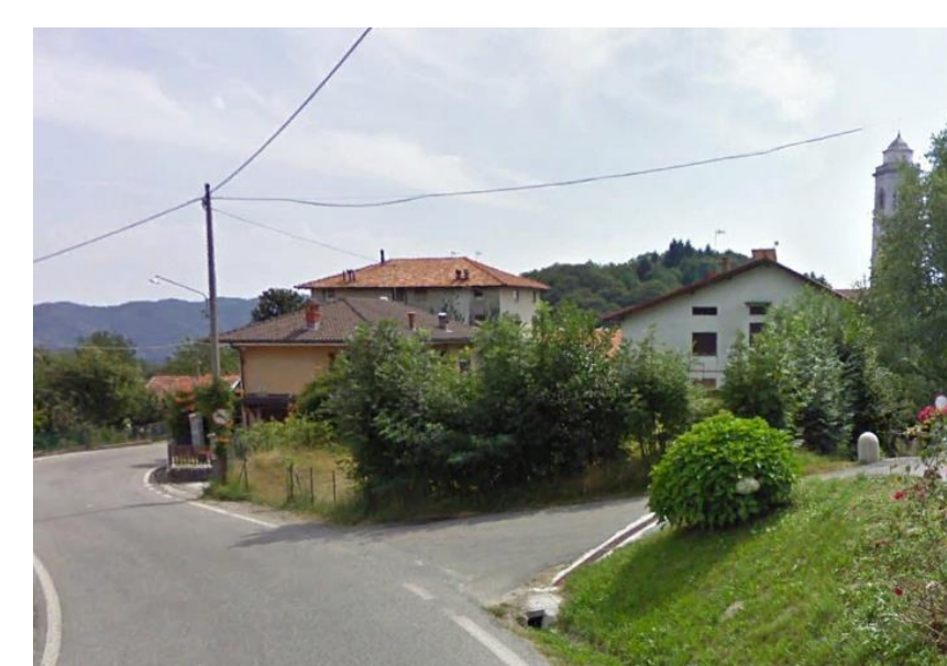
lotto B4.3 - vista da nord