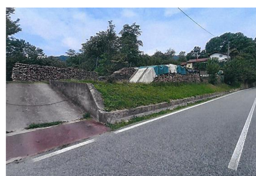
lotto B4.1 - vista da sud

Dalle foto sopra allegate (stagione invernale e stagione estiva) non risulta però visibile la parte di Carega in cui è localizzato il nuovo intervento artigianale D1.1. (si visualizza Allera sullo sfondo e la parte più a valle di Carega)