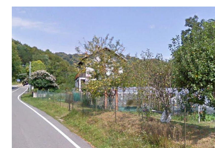
lotto B4.4 - vista da sud

Per quanto concerne la percezione visiva delle aree di nuovo intervento (B1.1, B1.3, e B1.4) localizzate lungo la strada panoramica SP 77, il contenimento dell'altezza e la presenza di ambiti edificati contigui limita le interferenze con le visuali complessive; sopra alcune foto illustrative di tali visuali.